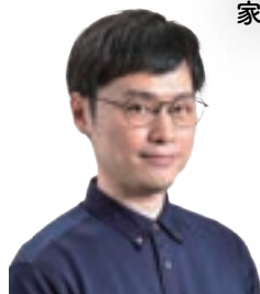
評論家 荻上 チキ